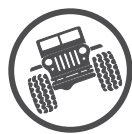
נעילות דיפרנציאל מקוריות

ג'יפ רנגלר משלב מראה קלאסי ומעוצב עם יכולות השטח המתקדמות ביותר.